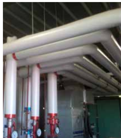
> Réalisation de locaux techniques > Réseau de tuyauterie carbone. Région Bruxelloise Centre hospitalier