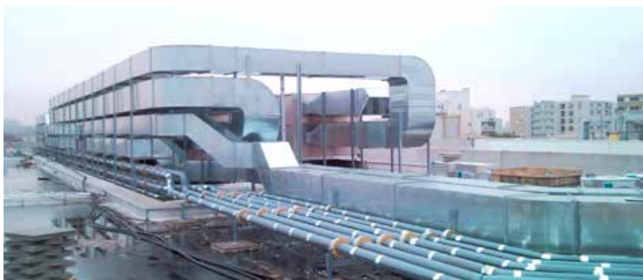
> Réalisation des réseaux aéroliques et hydroliques Île de France Centre commercial